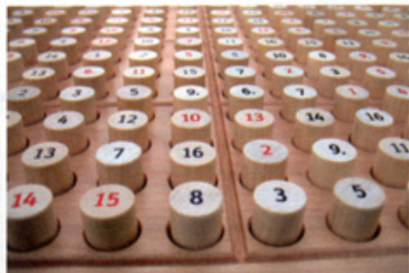
«Mega-Sudoku» für absolute Profis.